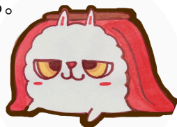
イメージキャラクター ぬくぬくん