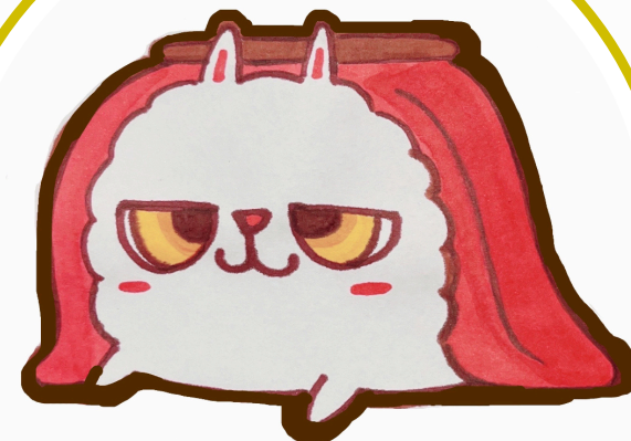
イメージキャラクター ぬくぬくん