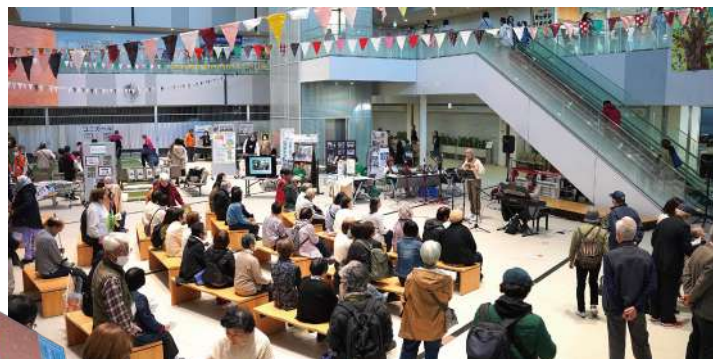
▲参加131団体・169企画、期間中の来場者は総計9,667名にのぼりました！

まちカフェ！は、町田市内で活動するNPO、市民活動団体、地域活動団体、ボランティアなどが実行委員会を組織して開催するイベントです。 「活動を多くの人に知ってほしい」「一緒に取り組む仲間と出たい」「企画や広報に必要なスキルを身につけたい」「新しい活動をしたい」など、 失敗も大歓迎のチャレンジの場であり、多様な地域活動が出会い、人と人、人と組織が繋がる地域活動のプラットフォームです。 ただいま2025年度の参加者・参加団体を募集中です。 みなさんのご参加をお待ちしています。