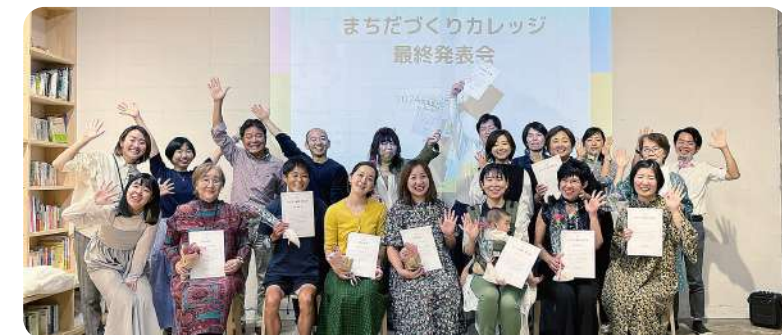
▲昨年のまちだづくりカレッジ最終発表会のようす。

まちだづくりカレッジはサポートオフィスで人気の連続講座です。団体の〈これから〉を考える組織づくりコースと、個人の〈好き〉から企画を考えるナリワイ起業コースがあります。特徴は一方的に「答え」を学ぶだけではなく、参加者同士や団体メンバー同士の対話の時間を大切にしていることです。参加者同士や過去の受講団体との交流の機会もあるので、町田市内で活動する団体同士の出会い、交流、協働のきっかけとなっています。