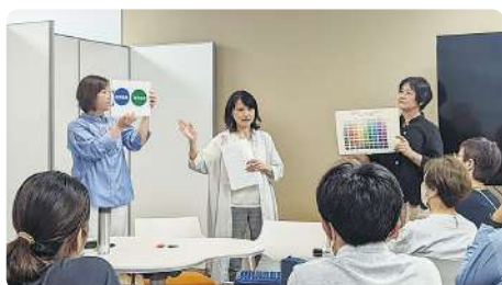
▲色彩心理グリーンハートラボさんのワークショップの様子

まちカフェ!参加団体の新たなチャレンジや、他団体との協働イベント実践を応援する機会です。ミニ講義やワークショップを実施して自団体の活動を紹介できます。参加団体募集中です！