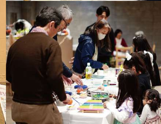
▲2024年度の助成団体による実施報告会&チャリティーイベントの様子。2025年度の募集概要についての説明も実施しました。