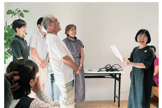
▲まちだづくりカレッジでは、(団体のビジョンが達成した日)が卒業の時。事業計画発表後、団体のみなさんの(卒業)の日まで、ずっと伴走し続けますという話と共にカレッジの名物ともなっている「留年証書」の授与が行われました。