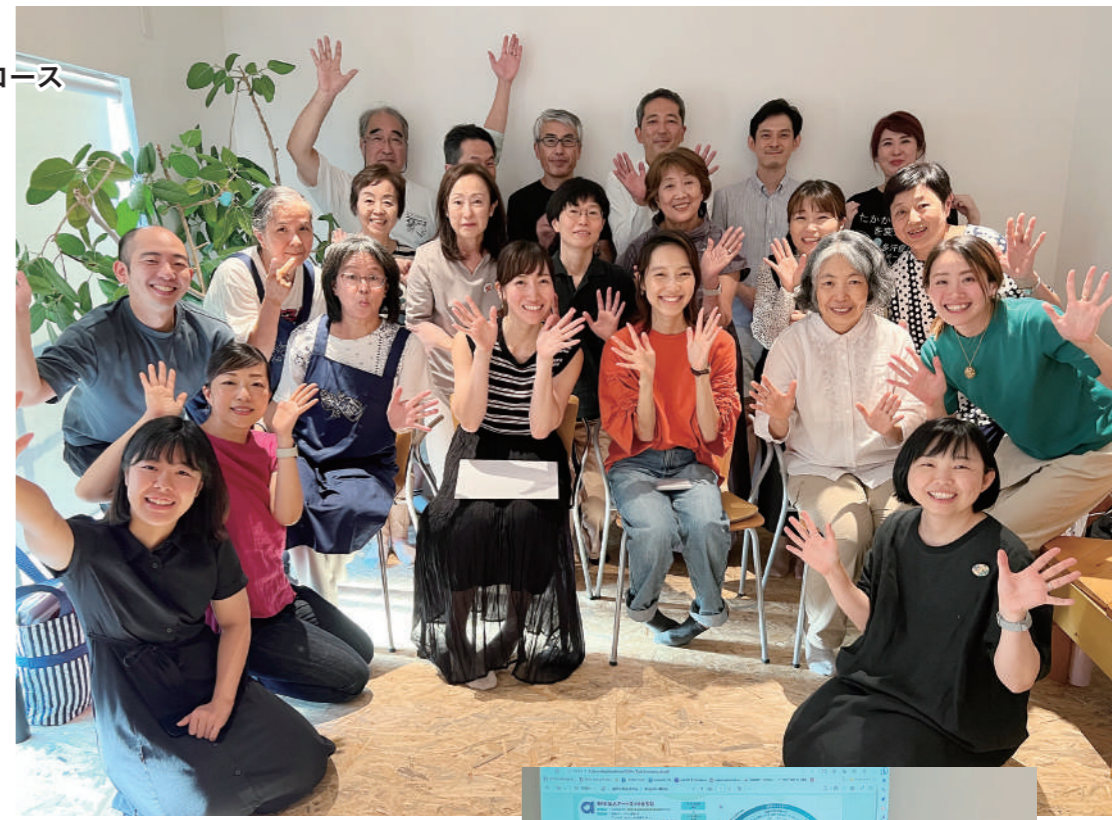
事業計画発表を終えてほっとしたみなさんの顔が印象的です。当日は過去のカレッジ受講生の先輩たちも駆けつけてくださいました。